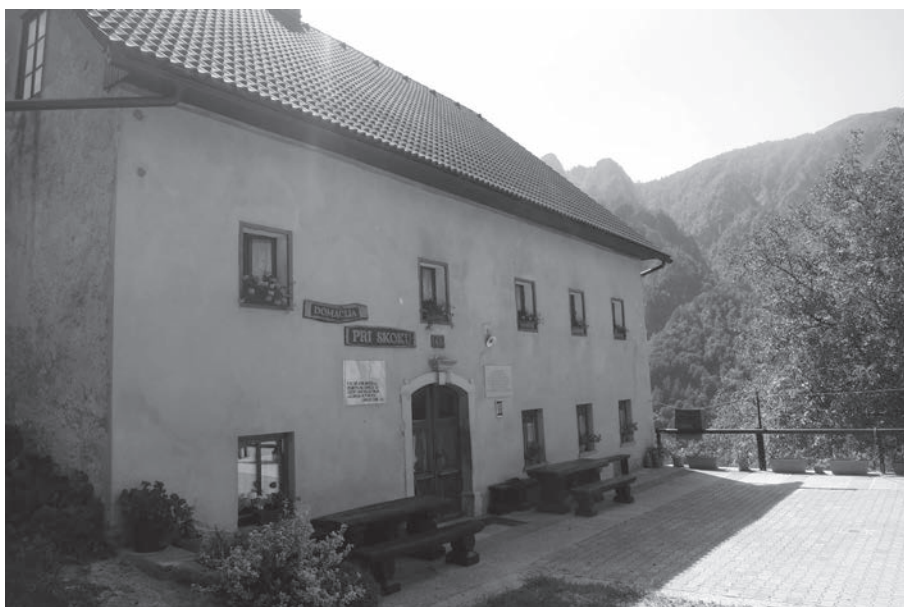
Abb. 3: Das Haus in Gorenja Trebuša, in dem die OZNA-Abteilung im Gebiet des IX. Korps im August 1944 gegründet wurde.