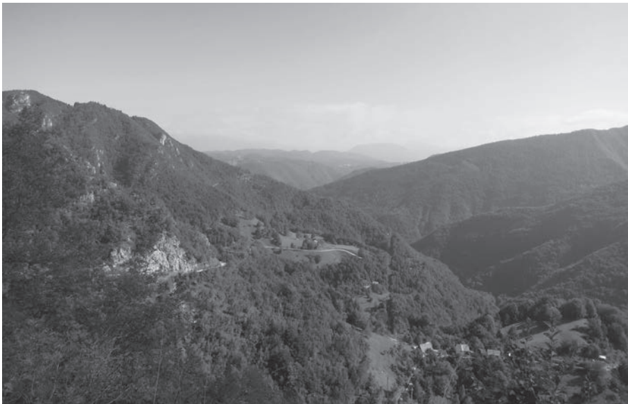
Abb. 2: Blick in das unzugängliche Tal von Gorenja Trebuša südlich von Tolmin, wo sich die OZNA-Abteilung im Gebiet des IX. Korps der slowenischen Partisanen befand.